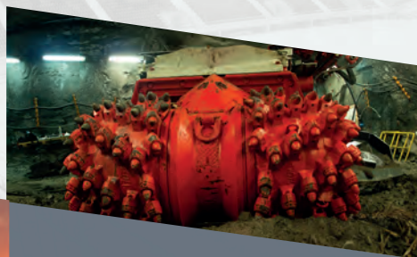
WYROBISKA CHODNIKOWE I KOMORY