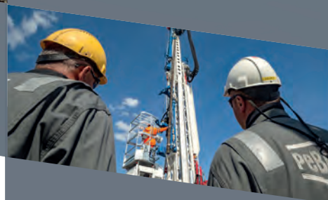
WIERCENIA POWIERZCHNIOWE I DOŁOWE